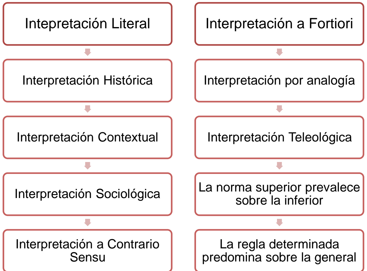
Figura 1. Esquema de Técnicas de interpretación