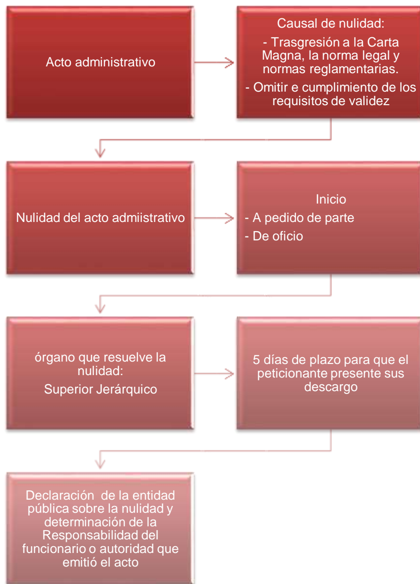
Figura 2. Esquema procedimiento de nulidad del acto administrativo