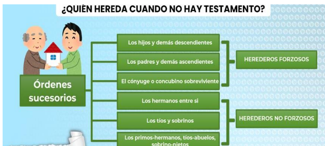
Figura 3: Órdenes sucesorios.

En el caso de existir testamento, ella se hace de forma unilateral, es decir expresa la voluntad del testador, los herederos pueden aceptar o no aceptar la misma, se hereda el pasivo, las deudas, cargas, tributos u otros que dejó el testador. Se debe tener en cuenta la valoración de los bienes patrimoniales, activos y pasivos, así mismo la repartición de la herencia abarca el pago de impuestos, sucesiones, donaciones, si hay acuerdo, mutuo acuerdo, acuerdo recíproco entre los herederos se procede a la repartición de la herencia, si existiese algún reclamo o pedido, se acude a la vía judicial.