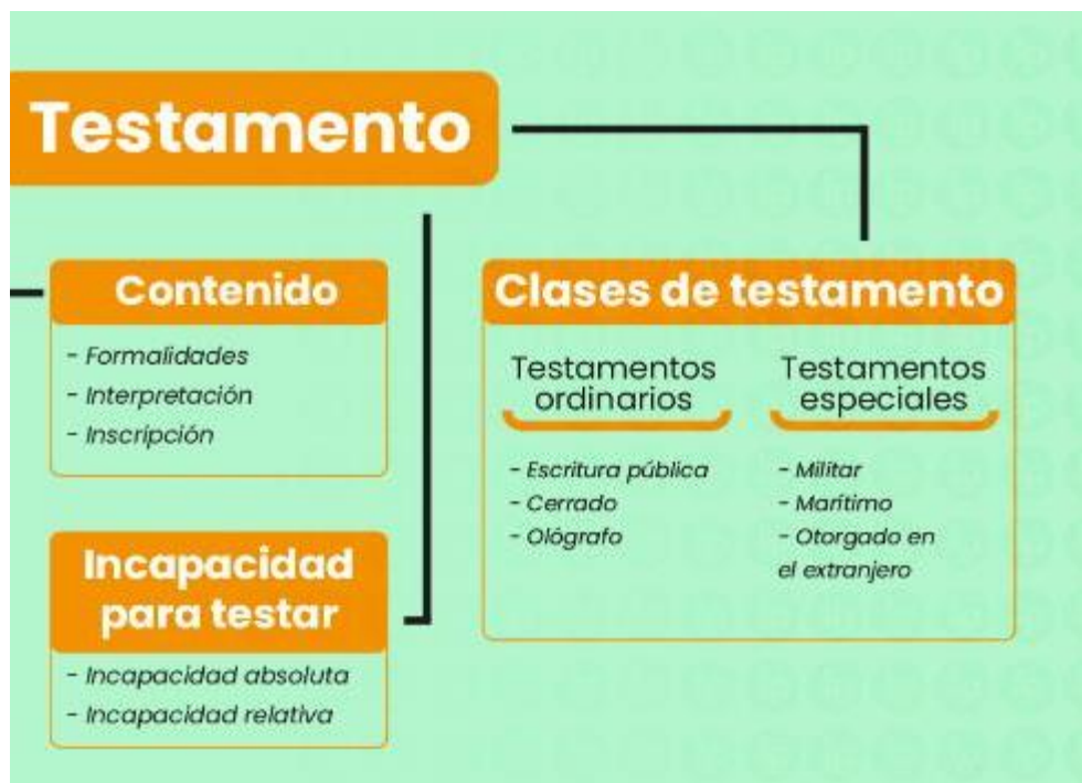
Figura 1: testamento.