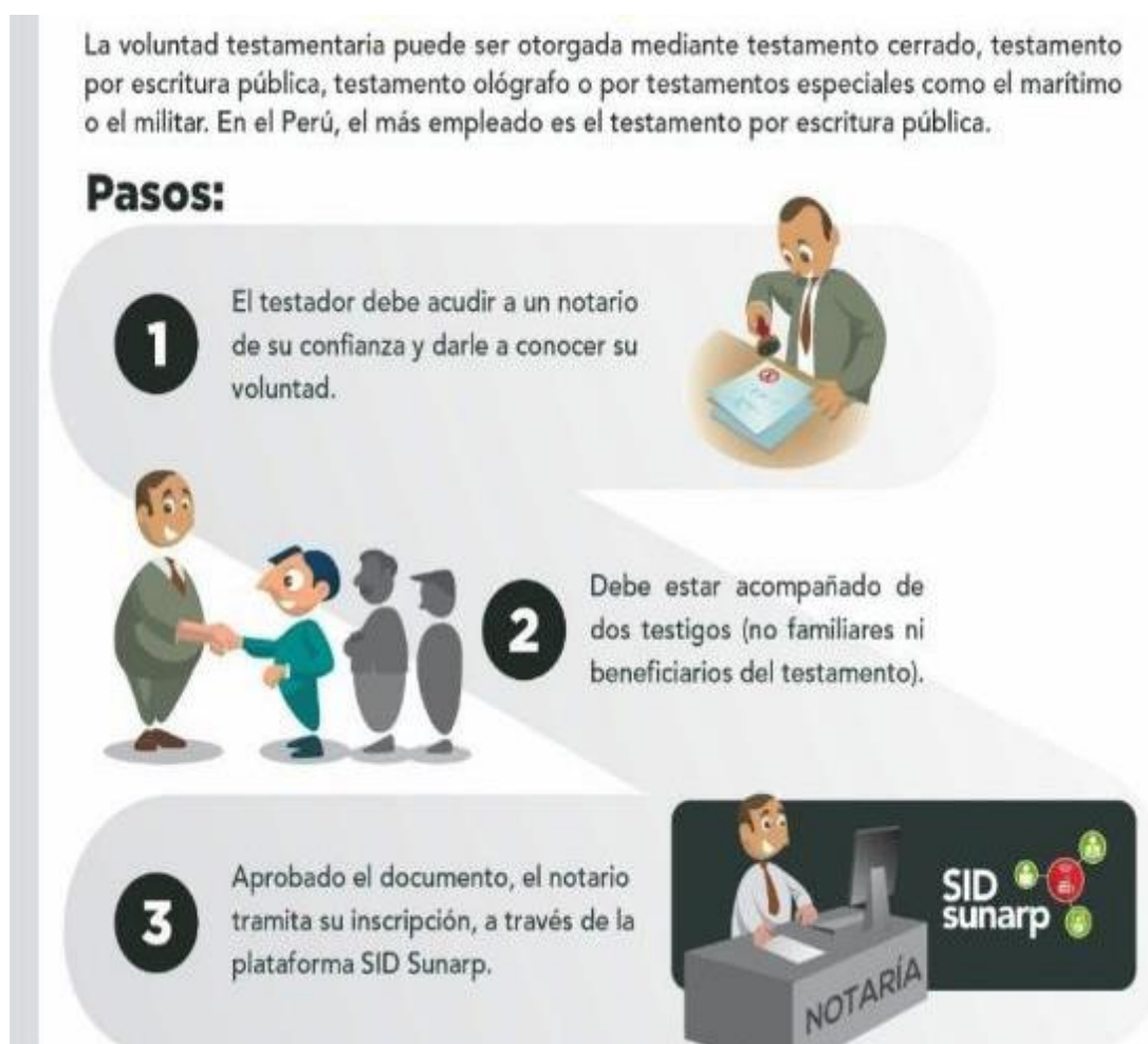
Figura 2: inscripción de testamento en los registros públicos.

Cabe agregar que los testamentos redactados ante notario público no registran fecha de caducidad, los testamentos ológrafos, caducan, fueron redactados a puño y letra, fue sin testigos, sin notario alguno, caducan a los cinco años, los testamentos por escritura pública, tiene mucha validez, son redactados ante notario público, es el más frecuente. A su vez cabe agregar que existen causas para pedir la nulidad del testamento: incapacidad mental, coacción, fraude, engaño, defectos de formalismo en la redacción, revocados, etc.